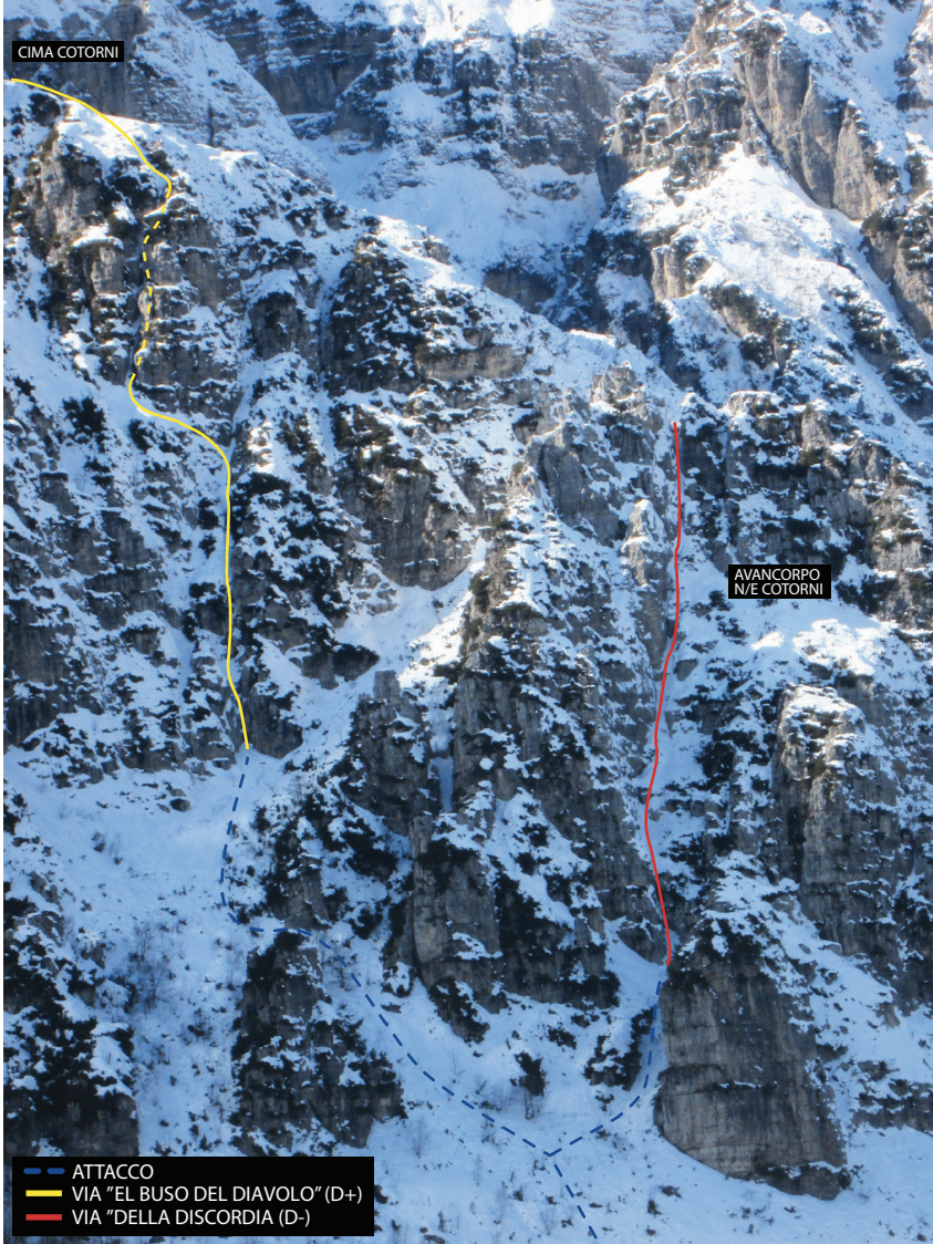
— ATTACCO — VIA "EL BUSO DEL DIAVOLO" (D+) — VIA "DELLA DISCORDIA" (D-)