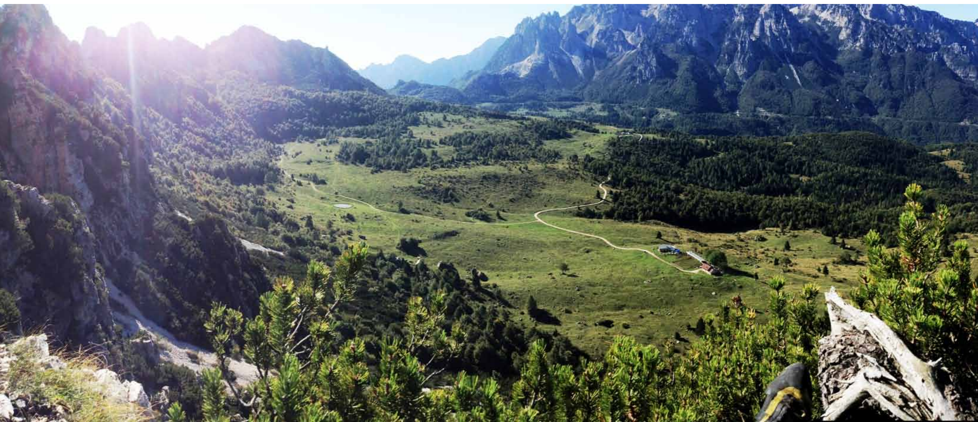
Il bucolico panorama che si ammira dalla cima della Torre Bovental .